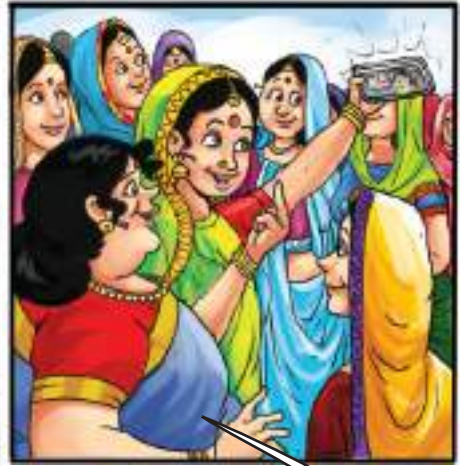
वोट सैल्फी तो बनती है!