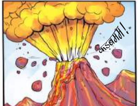
* साबू को गुस्सा आता है तो कहीं ज्वालामुखी फटता है।